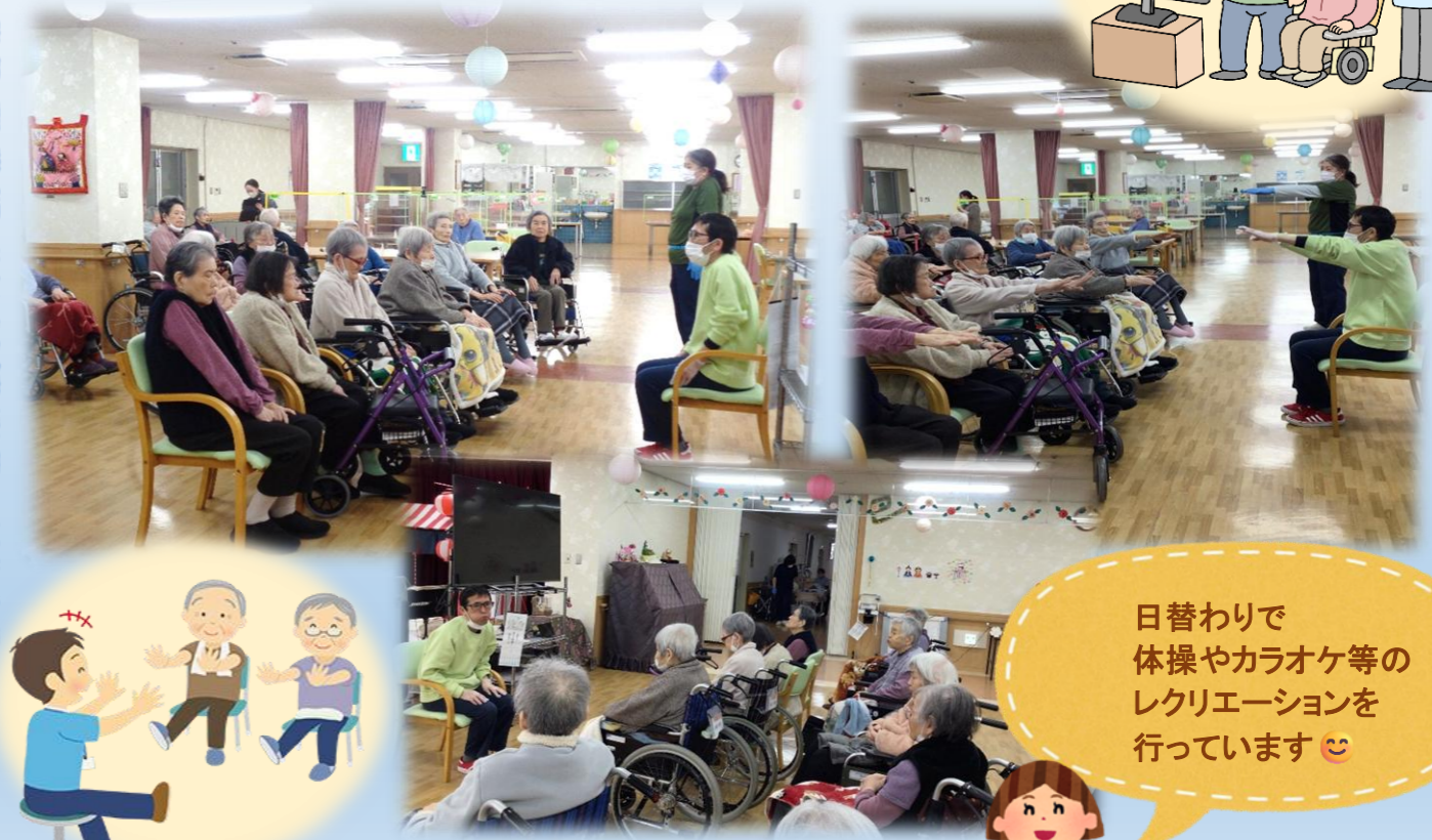
日替わりで 体操やカラオケ等の レクリエーションを 行っています