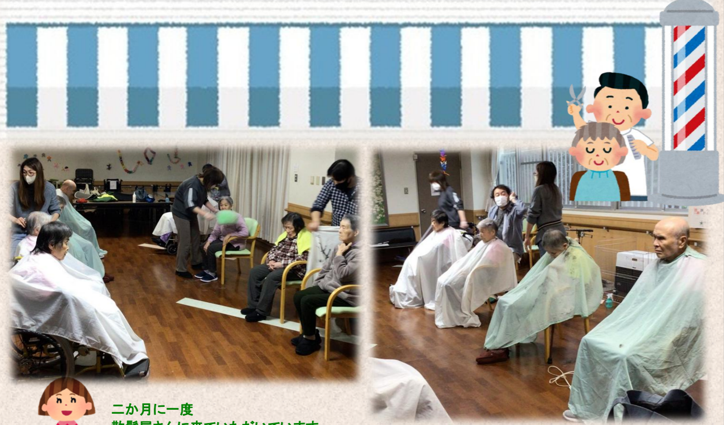
二か月に一度 散髪屋さんに来ていただいています